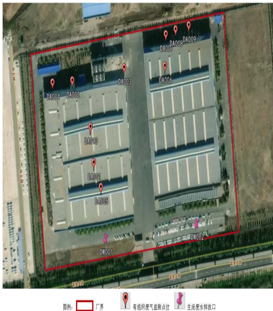
图3 监测点位示意图